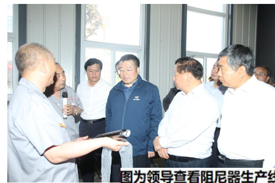
图为领导查看阻尼器生产线

风,依托国机集团的平台,实现转型发展,助力脱贫攻坚。真诚承诺,将从技术上、管理上苦练内功,把提升产品质量、降本增效作为亮点,以市场化运转模式融入,真诚合作。不会把扶贫作为护身符,给国机集团添负担,而是