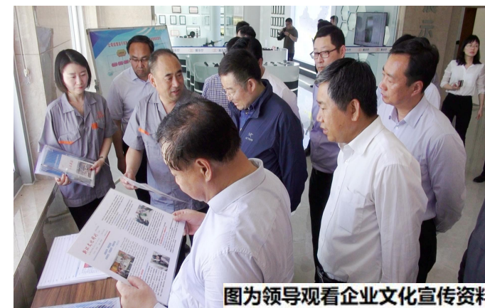
图为领导观看企业宣传文化资料

瞄准制约痛点短板,持续加大帮扶力度,重点帮助解决产业方面的困难问题;持续发挥中央企业履行脱贫攻坚责任的表率作用,强化责任落实,加强整改监督,将脱贫攻坚任务与定点扶贫项目同部署、同谋划、同监督;加大工作创新力度,提升帮扶质量。同时要加大扶贫宣传力度,谱写扶贫攻坚新篇章,助力平陆打好扶贫攻坚战。