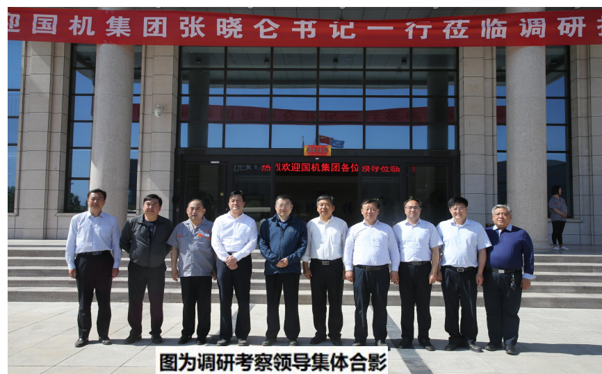
图为调研考察领导集体合影